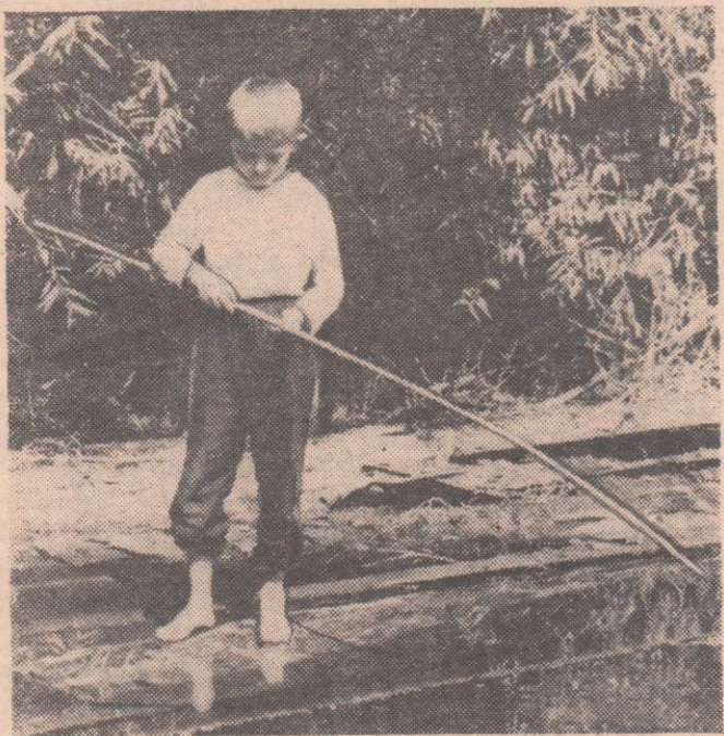
КЛЮНЕТ ЛИ ИЛИ НЕТ?