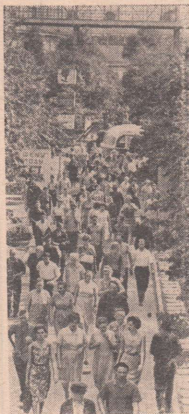
На главной аллее завода после рабочего дня.